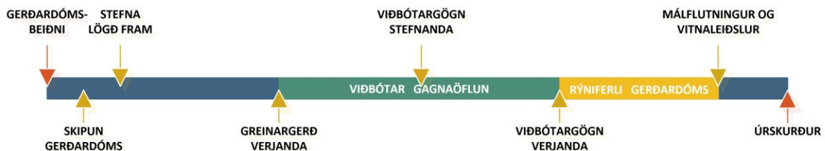
Mynd 2: Dæmigert ferli (tímalína) máls fyrir gerðardómi

Eins og sést á einfaldri tímalínu í mynd 3 þá er hér um að ræða ferli sem þarf gott utanumhald til að það gangi hratt og vel fyrir sig. Í ad-hoc gerðardómum er það alfarið á ábyrgð gerðardómsins að skilgreina tímafresti og halda aðilum við efnið en í þeim tilfellum þegar gerðardómurinn er rekinn undir hatti gerðardómsstofnunar þá er ferlið betur rammað inn með skilgreindum tímafrestum og þá liggur ljóst fyrir hvað gerist ef annar hvor aðilinn reynir að tefja málið.